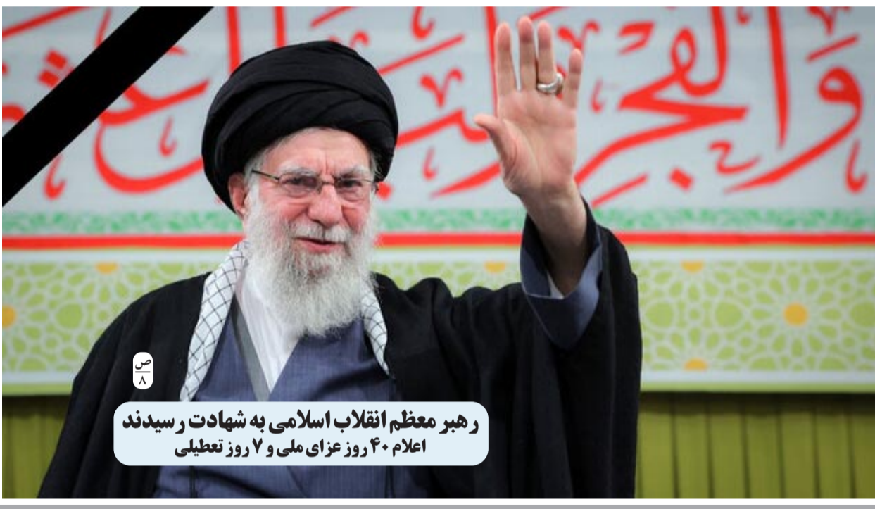
رهبر معظم انقلاب اسلامی به شهادت رسیدند اعلام ۴۰ روز عزای ملی و ۷ روز تعطیلی